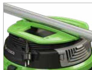
ЕРГОНОМІЧНА РУЧКА З ІНТЕГРОВАНОЮ КАБЕЛЬНОЮ ОБМОТКА