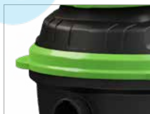
БІКОВИЙ ЗАХИСТ ВІД ДВЕРЕЙ І СТІН